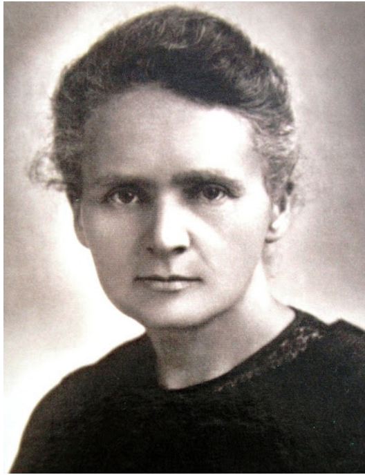
Maria Skłodowska Curie