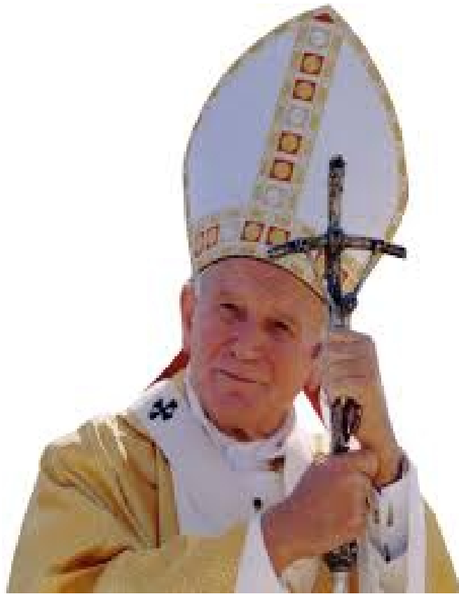
Jan Paweł II