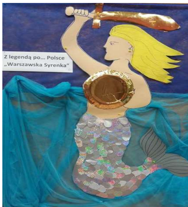
Wzór syrenki do wykonania pracy plastycznej