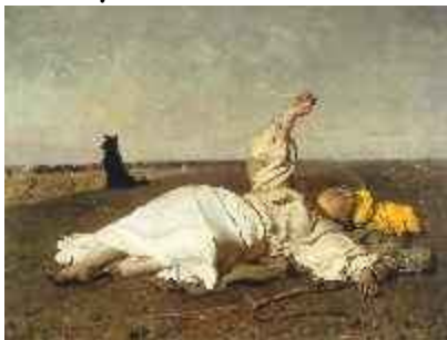
Babie lato to również tytuł obrazu znanego malarza Józefa Chełmońskiego

Nici babiego lata są roznoszone z prądami powietrza często na znaczne odległości, sięgające nawet kilkuset kilometrów. Dzięki tej umiejętności rozprzestrzeniania się pająki zasiedlają większość obszaru wszystkich kontynentów.